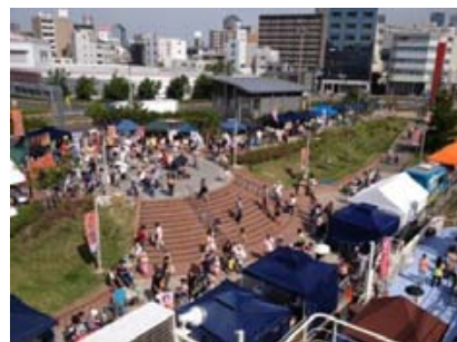
飲食・物販ブースのほか、様々なイベントをお楽しみいただきました。