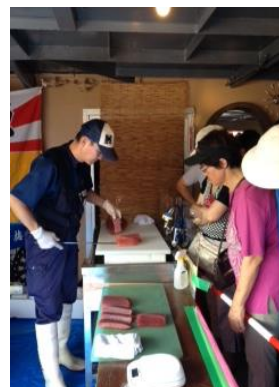
まぐろの切売販売