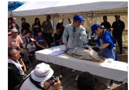
高知県とのコラボ企画「高地海洋高校女子高生！ツナガールによるマグロの解体実演」