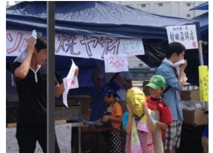
じゃんけん で子供に勝つ と焼きそばが割引に！