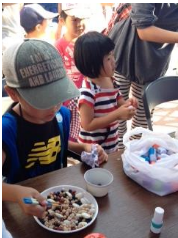
子どもコーナーでの豆運び (食生活改善推進委員会)