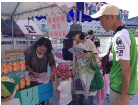
スイーツデコ体験 (マザープラス)