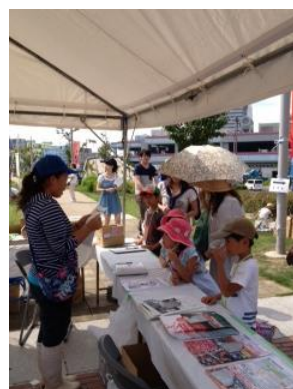
キッズ職業体験受付の様子