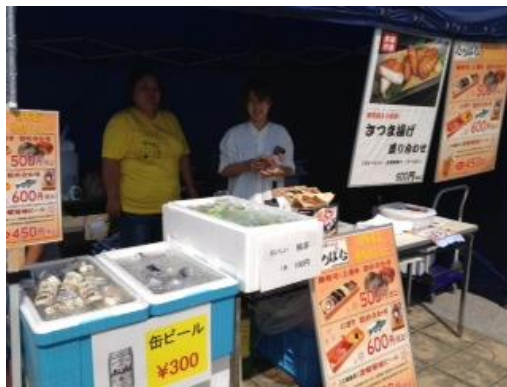
暑期中、ビールやジュースの 売れ行きも上々でした。 (魚河岸たちばな、和食のげんし)