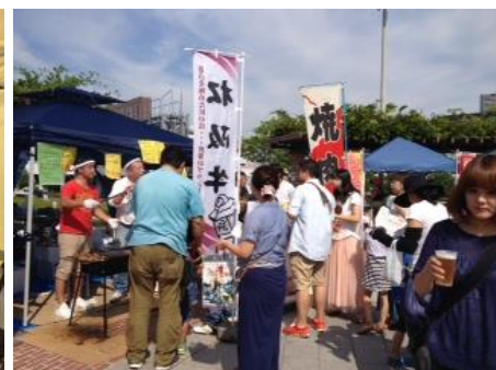
松坂牛の屋台も盛況 (ジャパンウエスト)