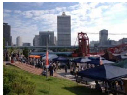
今回も4千人近くの来場者がありました。

せり体験には、常連・新規を問わず、大勢のお客さまが集まり、お目当ての魚を競り落とそうと熱心なまなざしを向けておられました。台船上室内でのマグロの切り身量り売りや、今回新たに開催された高知県とのコラボ企画「高地海洋高校女子高生！ツナガールによるマグロの解体実演」、かつおの薫焼き体験も大人気でした。お店の販売体験が出来るキッズ職業体験や2店舗(クッチーナ笠井・オタフクソース)で開催されたキッズレストランにも多数の申し込みがあり、子供たちの元気な歓声が会場を盛り上げていました。