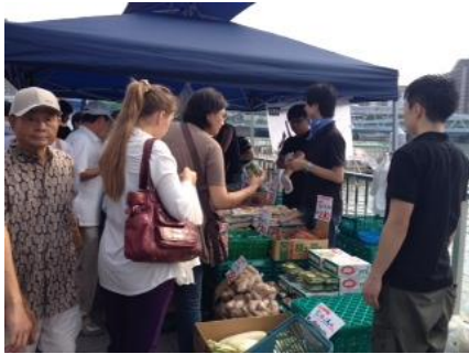
新鮮野菜をゲットしようと早朝から人だかり (八百鮮)