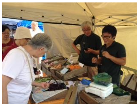
無農薬・有機栽培野菜の販売 (ととろみファーム)