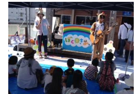
船上ファミリーコンサート