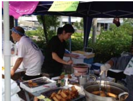
焼きアナゴ屋さん