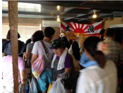
まぐろの量り売り大盛況(秤の故障で目分量で大奉仕や～)