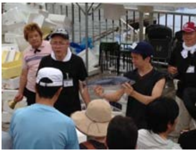
カツオ美味しいで