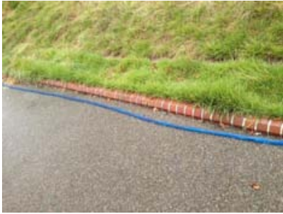
暑さ対策(ゴムホースの散水栓)