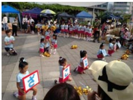
子どもチアリーディング