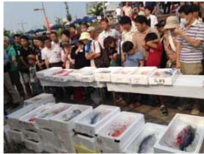
わあ～こんなにあるんや