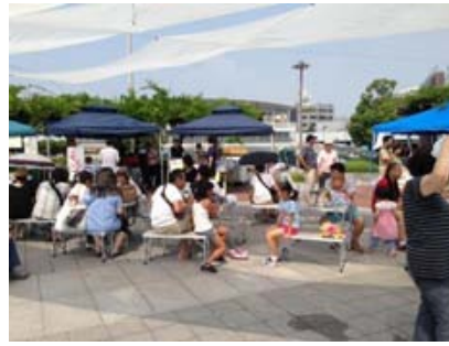
天空の天幕たなびく