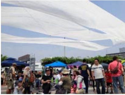
外灯に渡した苦心作