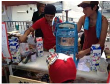
かき氷さんは売り切れました