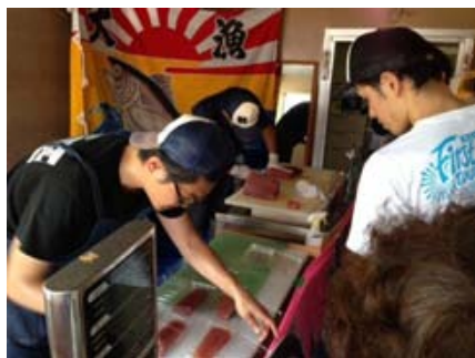
まぐろの量り売り