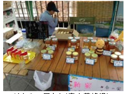
はちみつ屋さん(青山養蜂場)