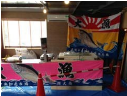
まぐろの量り売り場