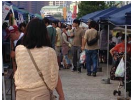
屋台の人波賑やか～