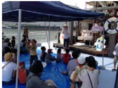
船上ファミリーコンサート