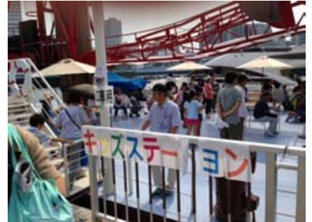
船上キッズステーション