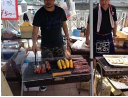
ベーコンステーキ