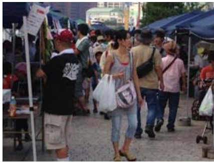
暑いけどたくさんの人出でした