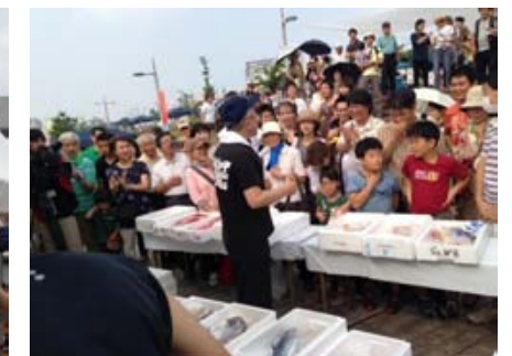
生きてるカニ! じゃんけんゲー!!