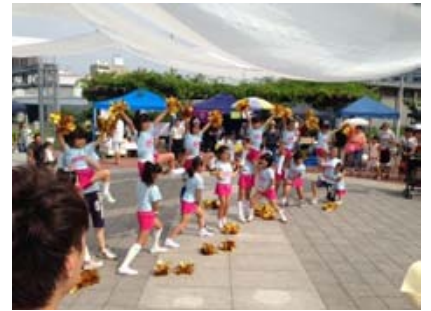
港区のキッズチアリーディングチーム(CLIPPERSクリッパーズ3歳~小4)35名