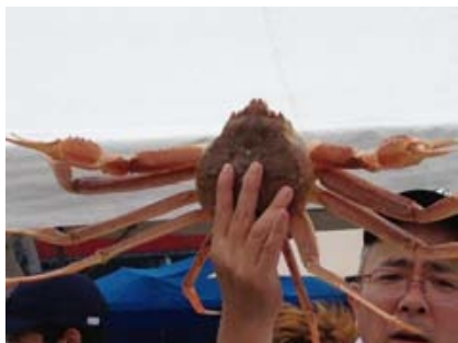
夏の競りは生きカニから